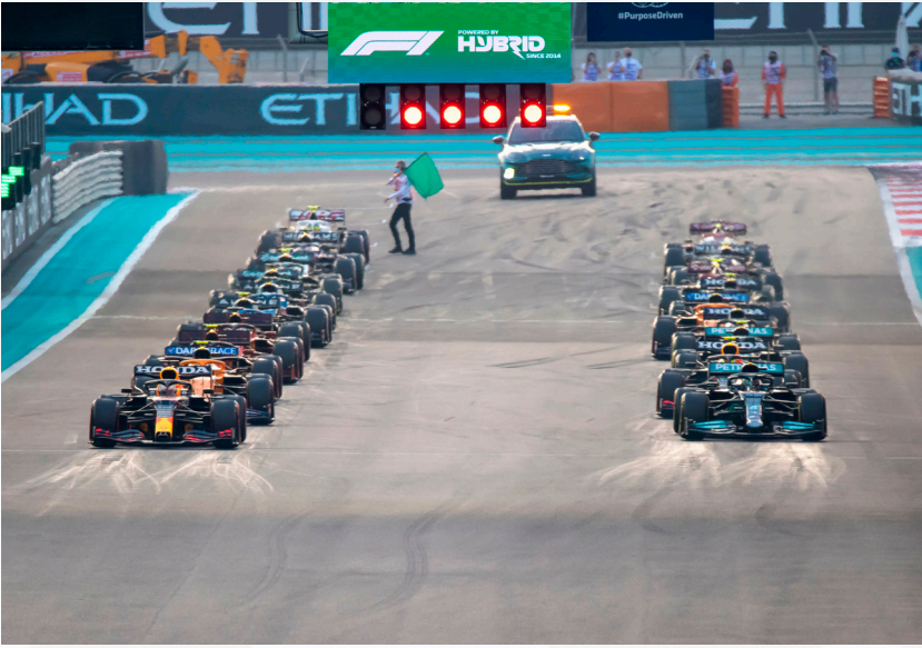
12. Dezember 2021. Zwanzig Rennwagen stehen in Abu Dhabi bereit.