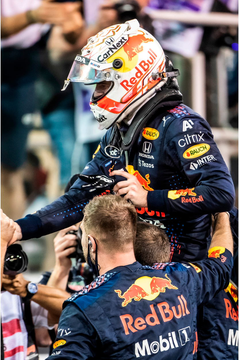
Max Verstappen ist Weltmeister und feiert den Sieg mit seinem Team.