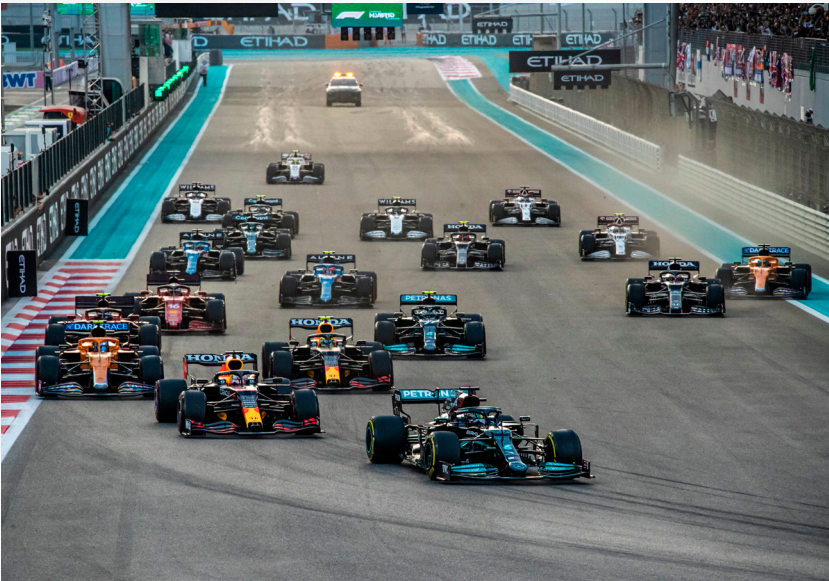
Das Rennen beginnt! Hamilton liegt sofort in Führung.